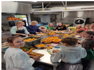
Samen pompoenen snijden voor de soep!

"Of we tekenen voor een 2de editie valt nog te bezien. Ik bedank in elk geval de leden van het oudercomité, Ferm en het schoolteam voor de helpende handen", besluit een trotse voorzitter.